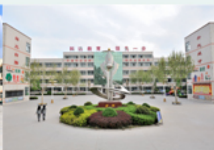
浚县科达学校（南校区）