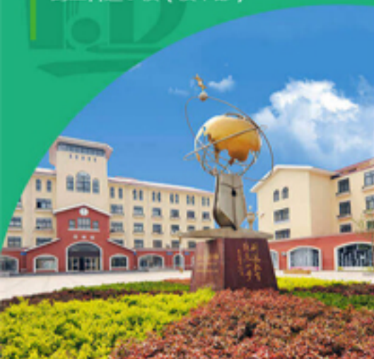
鹤壁科达学校（校本部）