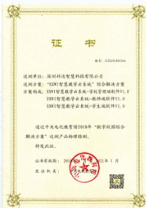
ESWI智慧教学云系统通过教育部备案