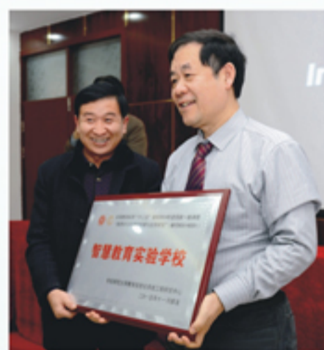
浚县科达中学（校区）成为全国教育科学规划“十二五”国家课题“智慧学习环境的构建与应用研究”实验校