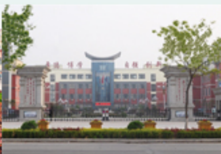
浚县科达中学（校区）