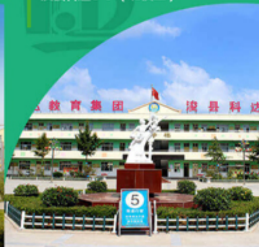
浚县科达小学（北校区）