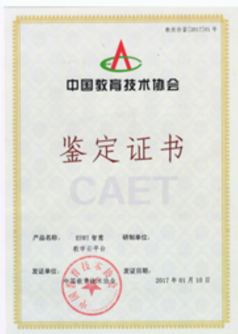
ESWI智慧教学云平台通过中国教育技术协会鉴定