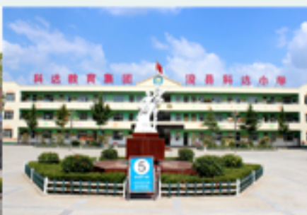
浚县科达小学（北校区）