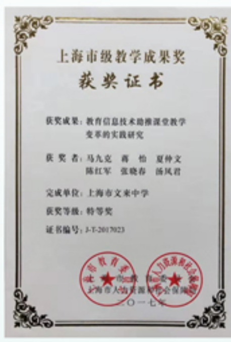
浚县科达中学（校区）参与、教育部校长培训中心专家马九克主持结项的课题获得上海市级教学成果特等奖