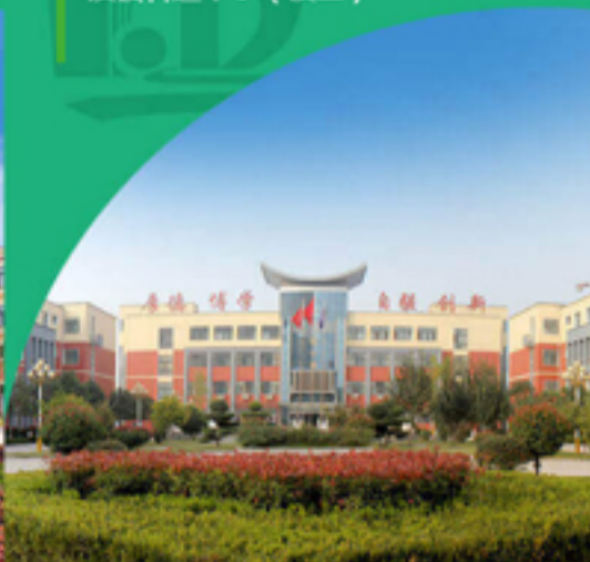
浚县科达中学（校区）