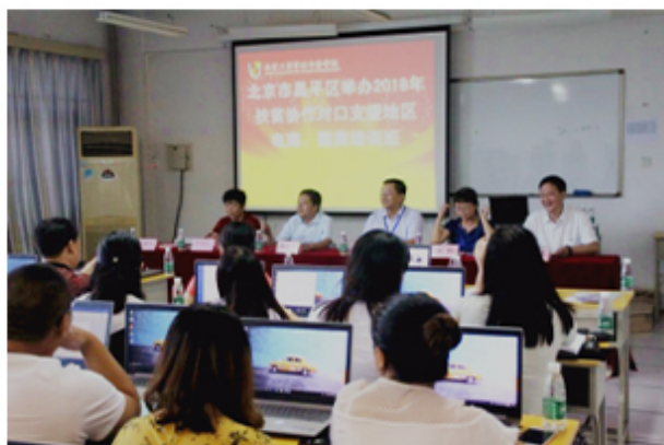
（图为我院承办的北京市昌平区电商、微商培训班教学场景）

2018年9月，学院受昌平区发改委的委托，承办了北京市昌平区电商、微商培训班，对昌平区不同岗位的47名学员集中进行培训，培训围绕电商扶贫主题，结合实际情况以及自身实践经验，为齐心协力打赢脱贫攻坚战、推进扶贫振兴战略注入新生力量。此举受到昌平区政府的高度肯定。