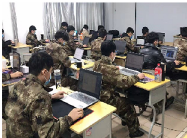
（图为学院免费为贫困学生提供的笔记本电脑）

教育扶贫，为提升国家整体教育质量，减轻学生和家长的负担，学院精准扶贫，资助贫困学生每人一台笔记本电脑。三年来，学校资助学生电脑金额共计1126万元。