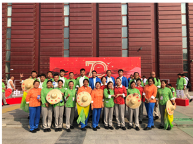
（图为社区群众参加建国70周年游行彩排）

学院长期为社区文化活动提供场地、设备等服务，与社区建立了良好的互动关系。在建国70周年活动期间，学院为社区群众游行彩排提供了场地和餐饮服务，受到了水厂路社区、街道办和社会各界的好评。