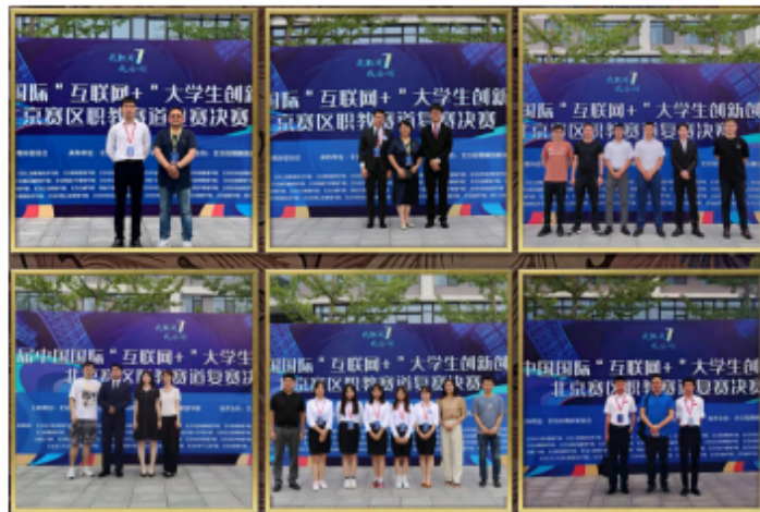
(图为国家开放大学实验学校北工商分校指导老师及参赛成员合影)